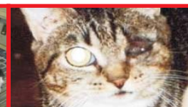
gata que teve seus olhos perfurados