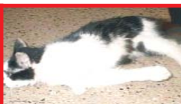
gata que teve sua coluna quebrada depois de ser chutada e arremessada