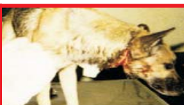
cão da praça que teve seu pescoço degolado