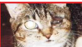
gata que teve seus olhos perfurados