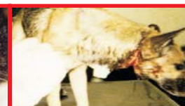
cão da praça que teve seu pescoço degolado