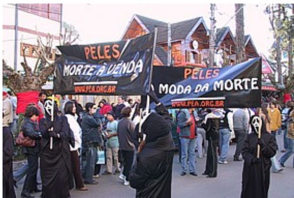
Manifestação em Campos do Jordão